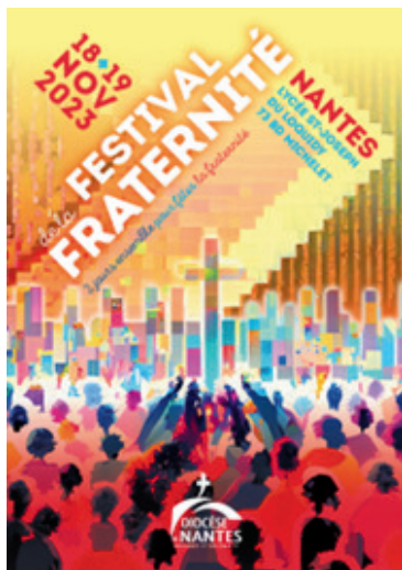
Week-end du 18-19 novembre au lycée Saint-Joseph du Loquidy, à Nantes

L'équipe de préparation : vigilance.solidarite@catholique-nantes.ccf.fr