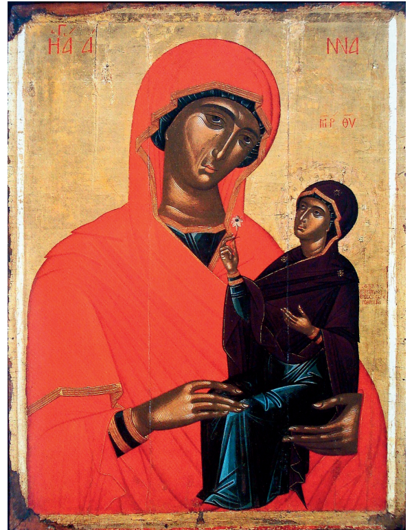
Sainte Anne et la Vierge, icône grecque du XVe siècle.